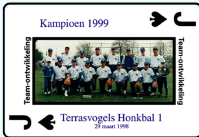
Schoppenboer uit "Mijn Toolbox (1998)": Mijn favoriete team.

Als je als team conflicten uit de weg gaat, zul je de fase van 'performing' nooit bereiken. Daarom luidt mijn advies: zoek de conflicten zo snel mogelijk op. Dat is in de praktijk een boodschap die vaak leidt tot veel hilariteit, maar het werkt wel.